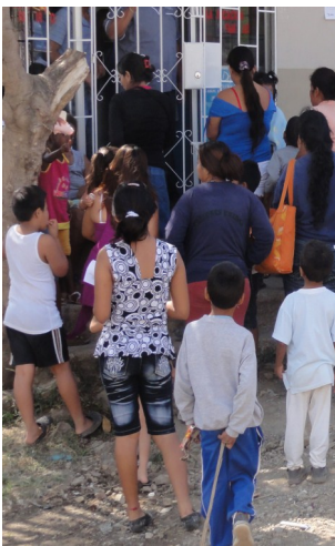
Nog steeds druk

Het regenseizoen is begonnen, het seizoen van dengue