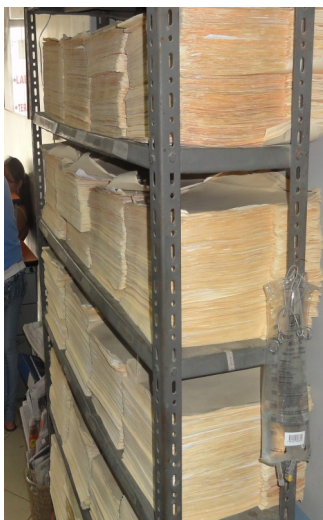
Meer dan 6000 patiënten- dossiers