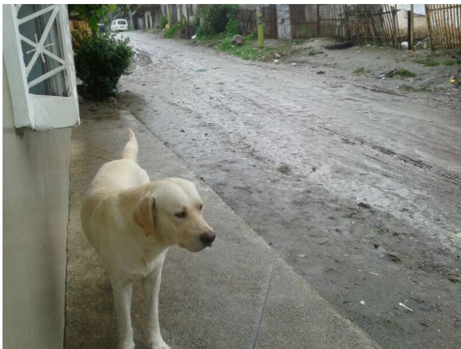
Regenseizoen, ook voor Cody hondenweer!

Ook blijft het aantal patiënten gestaag toenemen, in het archief zijn nu al meer dan 6000 patiëntendossiers opgeslagen en dagen waarop er meer dan 20 consulten zijn geweest, zijn geen uitzondering.