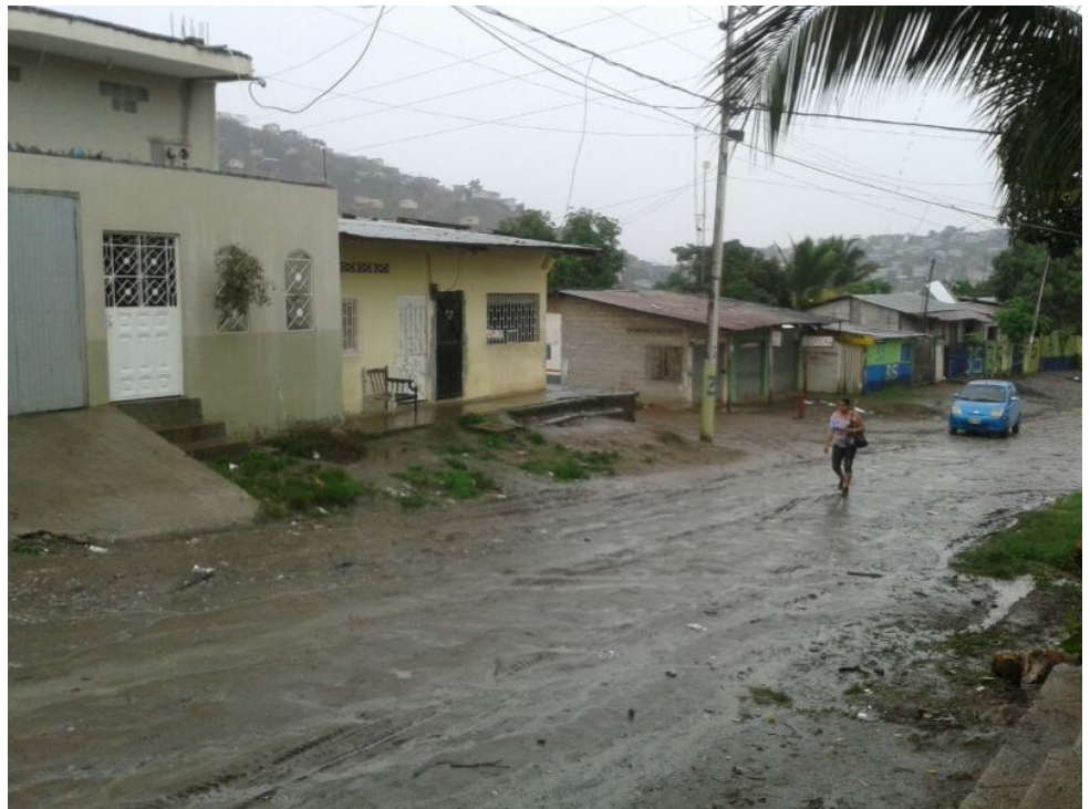
Het regenseizoen is begonnen.....

Een heel gelukkig nieuwjaar gewenst. Wij hebben het nieuwe jaar ingeluid in Nederland, maar zijn direct daarna terug gegaan naar Ecuador. Hier is ondertussen het regenseizoen begonnen met alle gevolgen van dien. Daardoor zijn de straten bijna onbegaanbaar geworden door de blubber, aangezien hier de wegen in onze wijk niet zijn bestraat. Dit geeft direct ook grote plassen en doordat het juist in de winter extra warm is, is dat een goede broedplaats voor muggen. Hierdoor zal Dengue binnenkort weer de kop op gaan steken, de eerste patiënten met verschijnselen hebben we alweer gezien. Ook hepatitis A wordt alweer gezien.