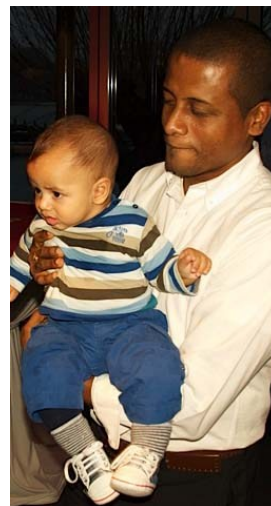
Een trotse vader met zijn zoon.

Dat een dergelijke bijeenkomst niet alleen gezellig, maar ook nuttig kan zijn bleek uit diverse aanbiedingen van hulp waar de stichting zeker gebruik van zal maken!