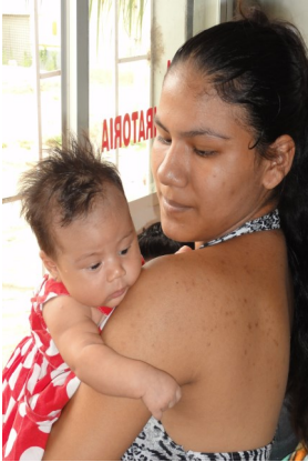
Even ter controle naar de dokter