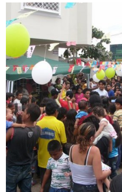
Zo druk was het vorig jaar bij het kinderfeest

Wilt u bijdragen aan ons werk : stort uw bijdrage op: Bankrekeningnr. NL53 TRIO 0784.8377.24 t.n.v. Stichting La Sonrisa Naranja te Rotterdam