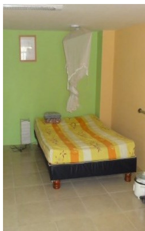
Voor stagiaires is een klein appartementje met douche en wc beschikbaar

La Sonrisa Naranja: Je komt in een warm bad!