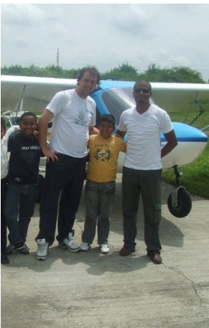
Bij een uitje van La Sonrisa Naranja maak je zelfs een vliegtochtje

Zoals je kunt zien is er veel interesse om de stichting te helpen