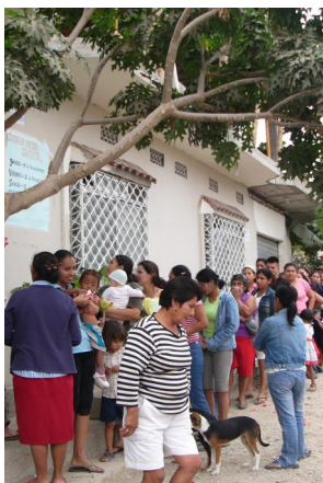
Grote belangstelling voor gratis consulten

Al met al een organisatie waar negen mensen hun medewerking aan verlenen