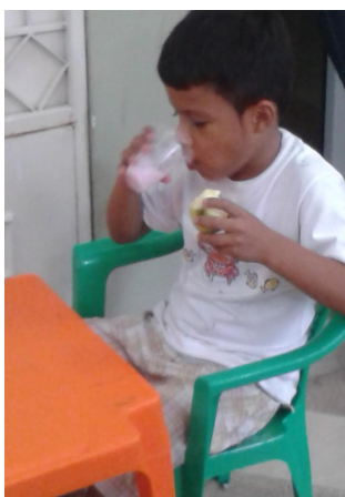
Tijdens zomerschool is er ook aandacht voor voeding

Al met al een organisatie waar negen mensen hun medewerking aan verlenen