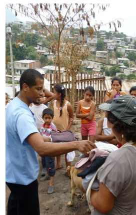
Uitdelen van ingezamelde kleding

Een fantastisch uitzicht over Rotterdam is inbegrepen