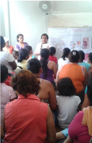
Drukte tijdens een cursus

Zoals je kunt zien is er veel interesse om de stichting te helpen