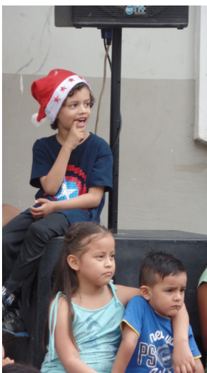
Wat gebeurt er nu weer.....

Allereerst moesten de kinderen uitgenodigd worden. Dit gebeurde in de eerste instantie in de kliniek waar kinderen zich in konden schrijven. Maar ook werd een reis gemaakt naar een verderaf gelegen wijk waar mensen in nog armoediger situatie verkeren. Daar werd de auto in de wijk geparkeerd en geloof het of niet, binnen korte tijd was de auto omringd met tientallen kinderen en werden op de motorkap hun namen genoteerd. Er meldden zich zoveel kinderen dat, tot telkeurstelling van velen, al snel de inschrijving afgesloten moest worden.