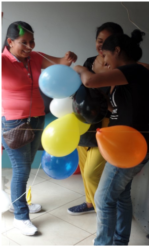
De ballonnen zijn klaar