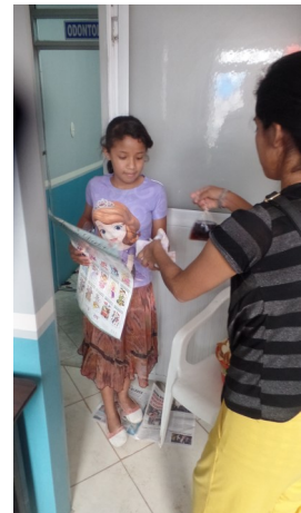
Ja, en nu ook nog een sandwich

Voor het overige wachten we af of de plannen voor een satellietvestiging in de wijk waar ook de kinderen voor het kerstfeest vandaan komen, levensvatbaar zullen blijken te zijn.