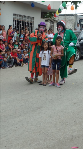
De clowns waren weer leuk

Er werd een loterij gehouden met als prijs een kalkoen en een levensmiddelenpakket