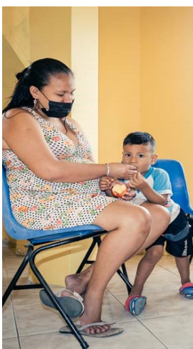
Bijna aan de beurt