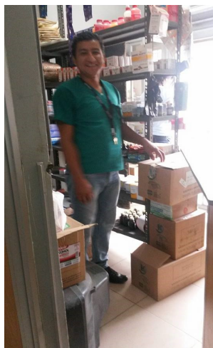
Weer nieuwe medicijnen