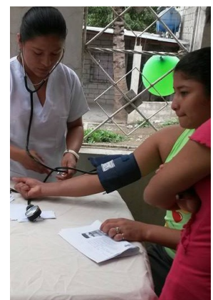
Bloeddrukmeting dagelijkse routine.

In januari komt er weer een nieuwe student