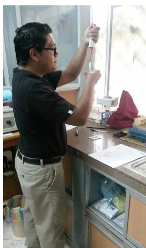
Elke namiddag worden de bloedmonsters gecontroleerd