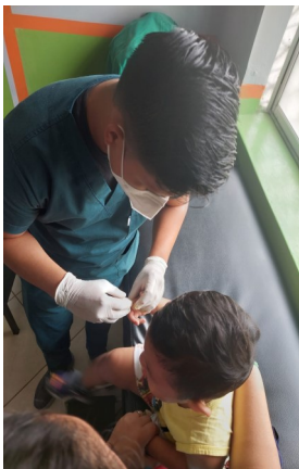
Even diep ademhalen

De vakanties zijn weer voorbij, de herfst begint en alles wordt weer opgestart. Daar hoort uiteraard ook weer een nieuwsbrief uit Ecuador bij.