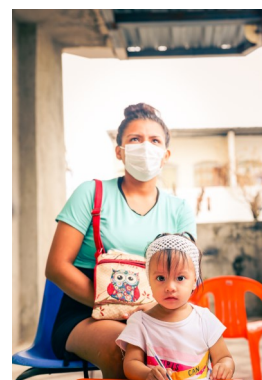
Even wachten en dan ben je aan de beurt.