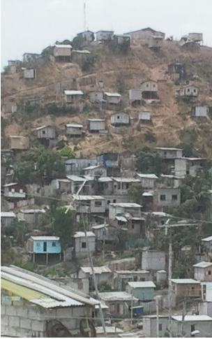
Het werkgebied van de stichting